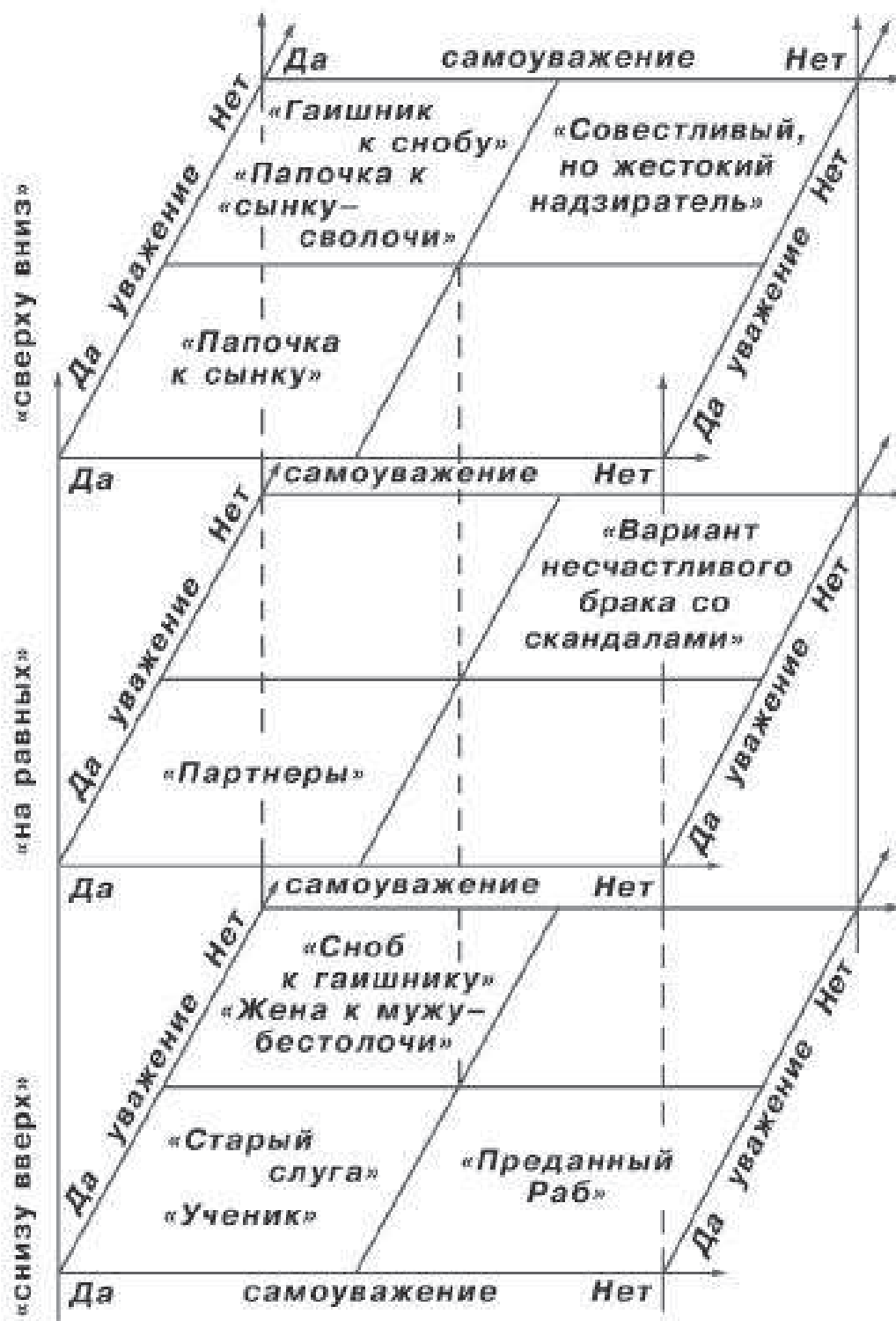
Рисунок 2. Пространство транзакций.