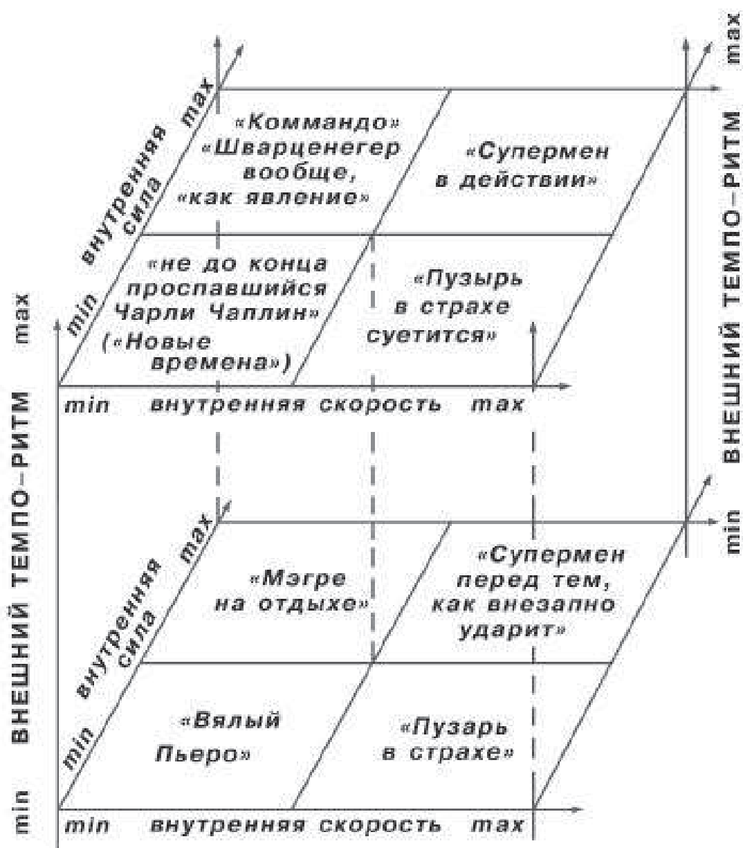
Рисунок 1. Пространство темпо-ритмов.

Различные сочетания внутреннего и внешнего темпо-ритмов могут соответствовать конкретным ролям, характерам, ситуациям — смотри рисунок 1. Один из квадратов заполнен вопросительным знаком — постараемся придумать ситуацию, соответствующую этому квадрату.