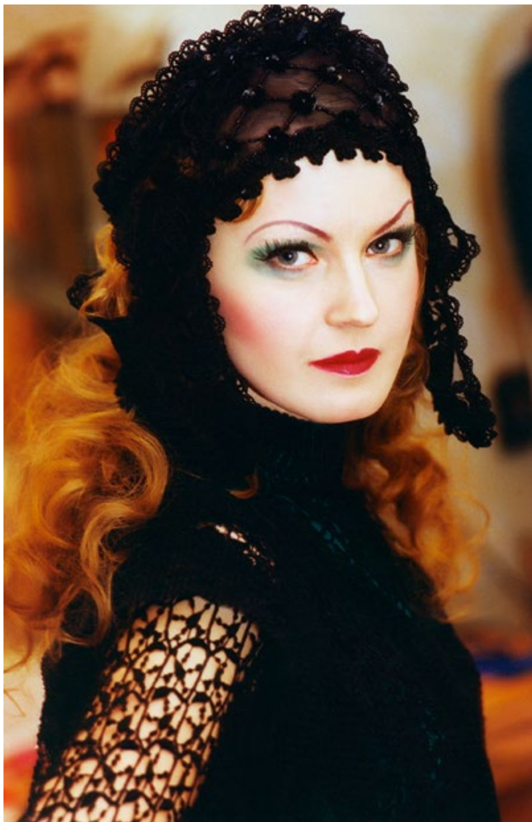
«Чудо святого Антония» (Ортанс). 1999 г.