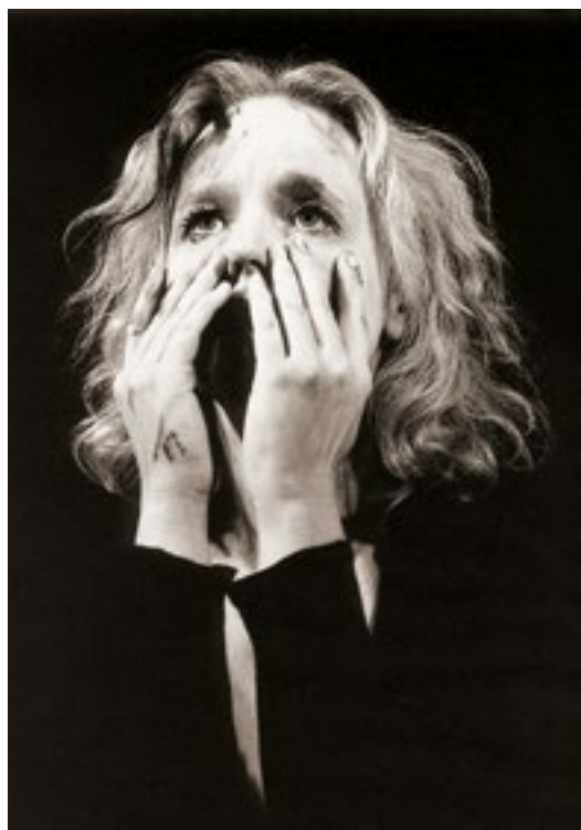
«Глубокое синее море» (Хестер). 2007 г.