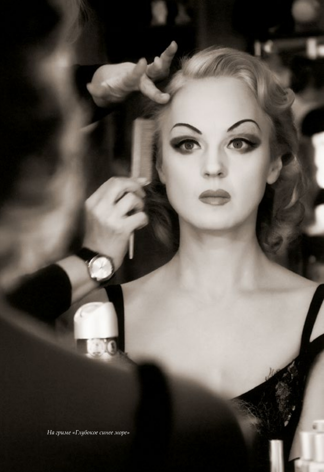
На гриме «Глубокое синее море»