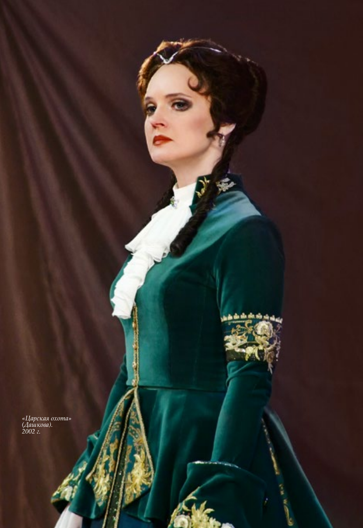
«Царская охота» (Дашкова). 2002 г.