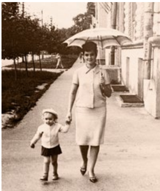
С мамой на прогулке