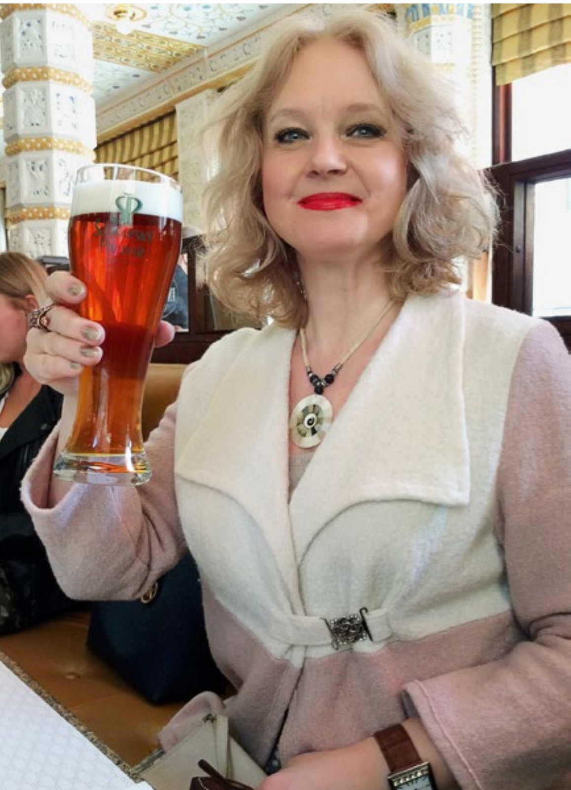
День рождения в Праге