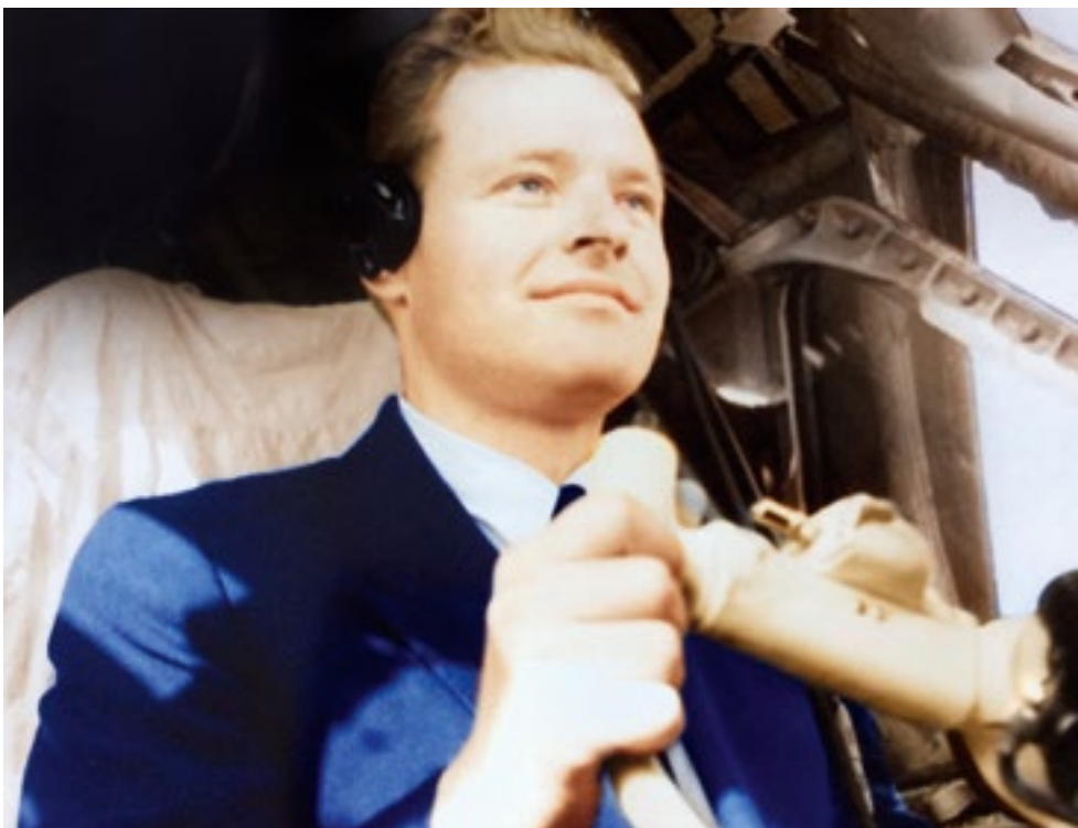
Папа за штурвалом