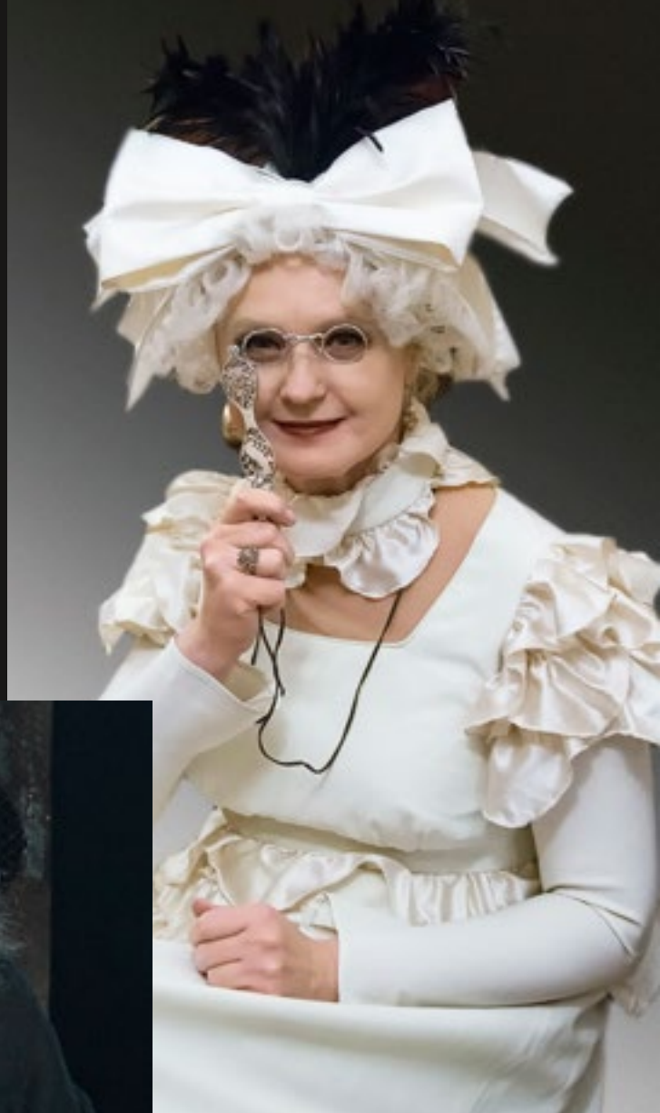
«Евгений Онегин» (Московская кухня). 2014 г.