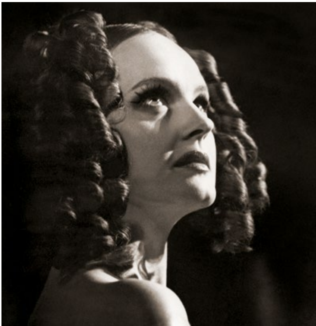
«Пиковая дама» (Полина). 1996 г.