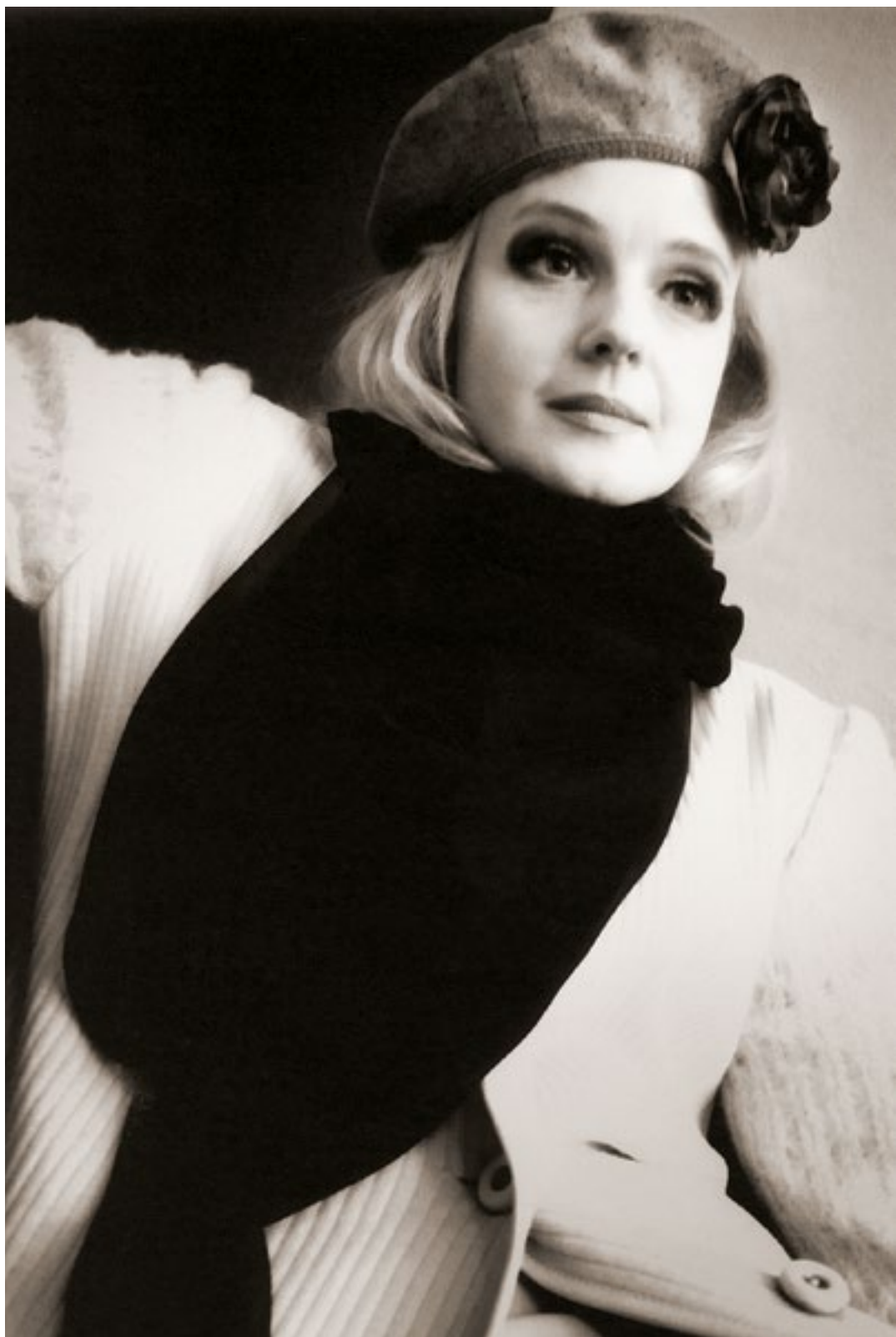
«Чулмск прошлым летом» (Хороших)