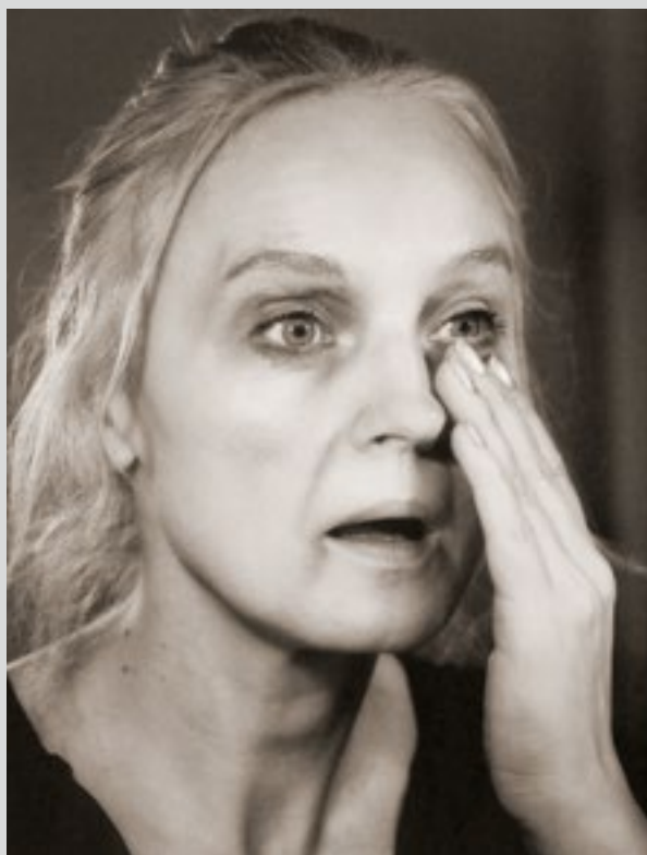
Грим к роли Фарпухиной в спектакле «Дядюшкин сон». Премьера спектакля – 2000 г.