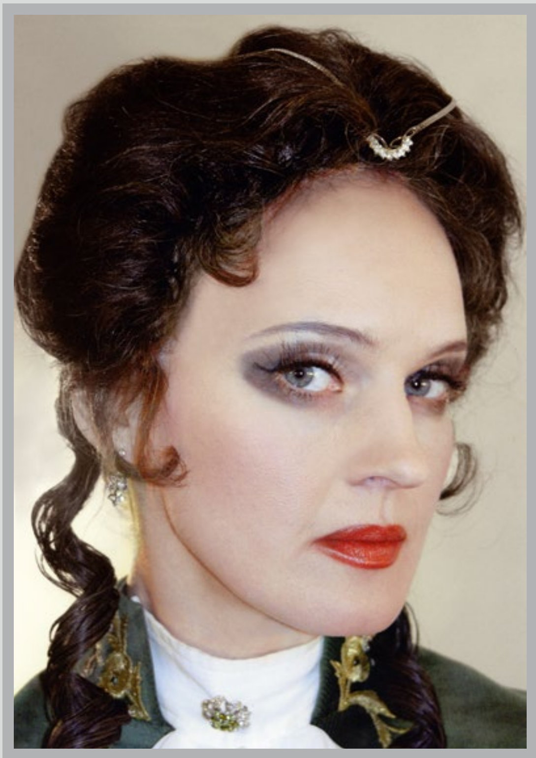
«Царская охота» (Дашкова)