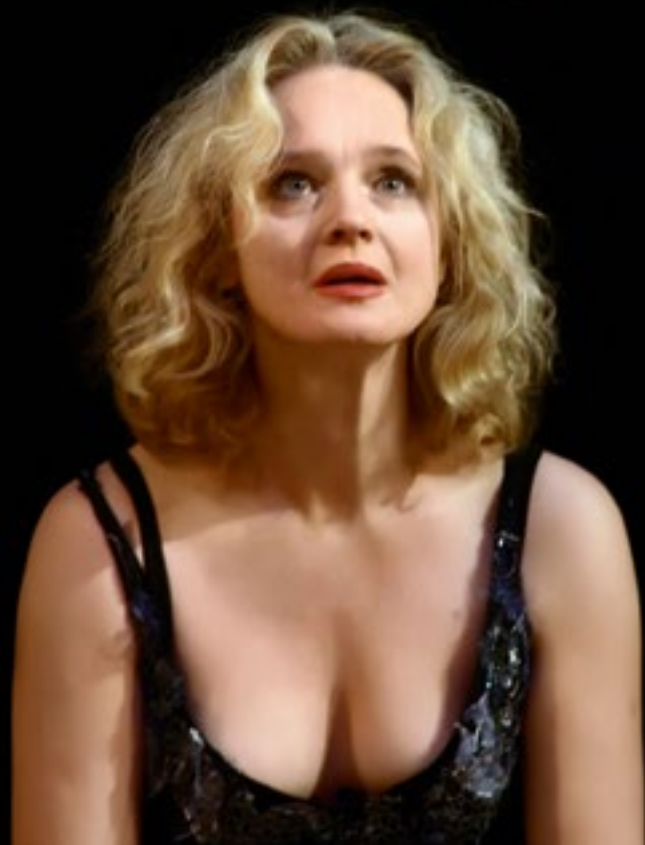
«Глубокое синее море» (Хестер)