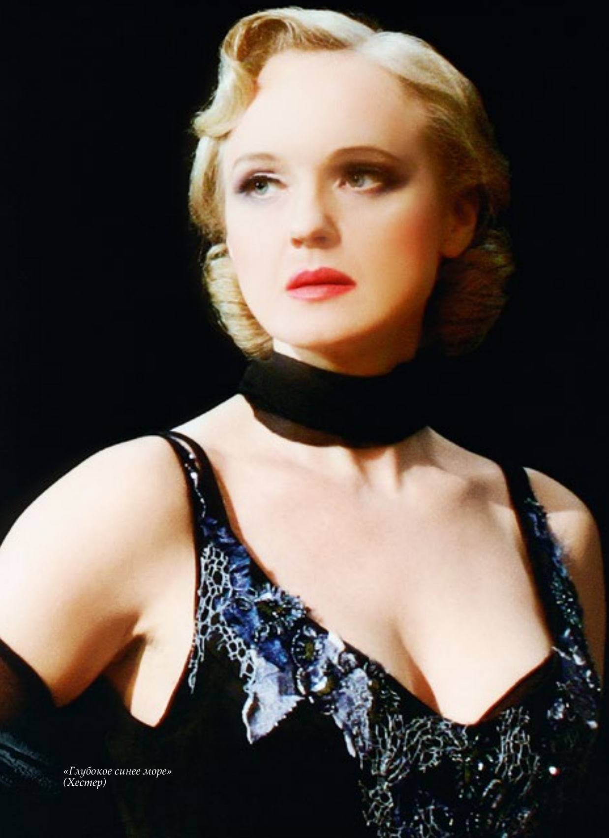
«Глубокое синее море» (Хестер)