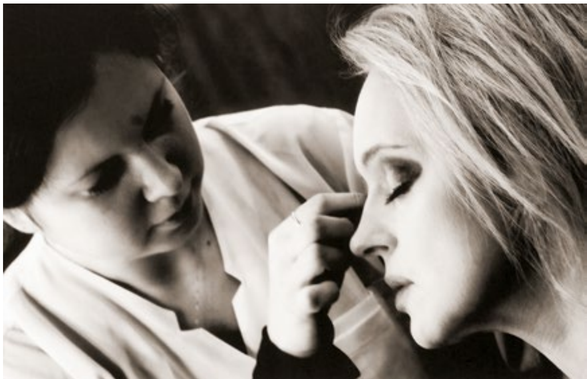
Будни актрисы. Грим. Отдых перед спектаклем