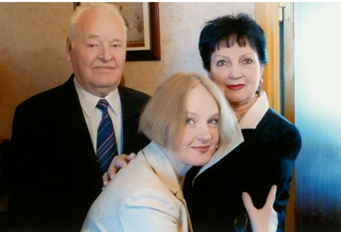
С папой и мамой. 2009 г.