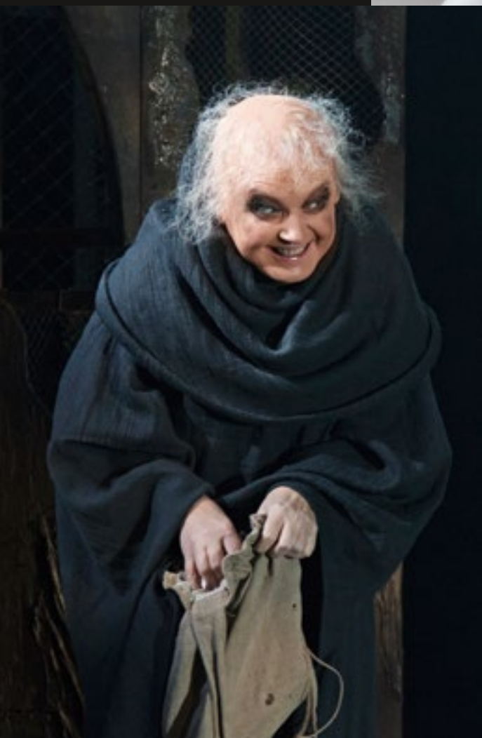
«Ричард III» (Королева Маргарита). 2017 г.