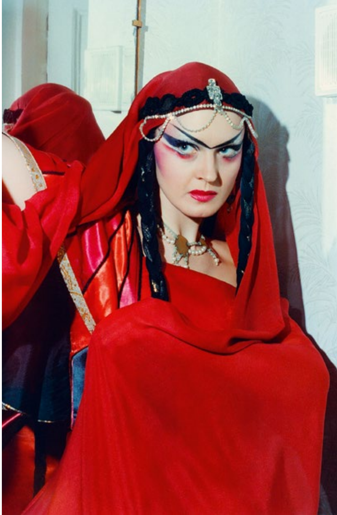
«Принцесса Турандот» (Адельма). 1996 г.