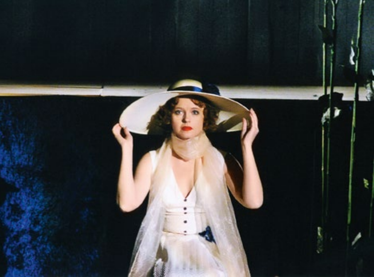
«Чулимск прошлым летом» (Хороших)