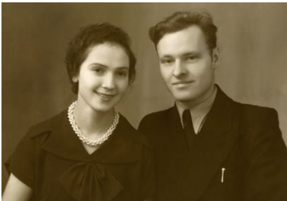
Родители в молодости