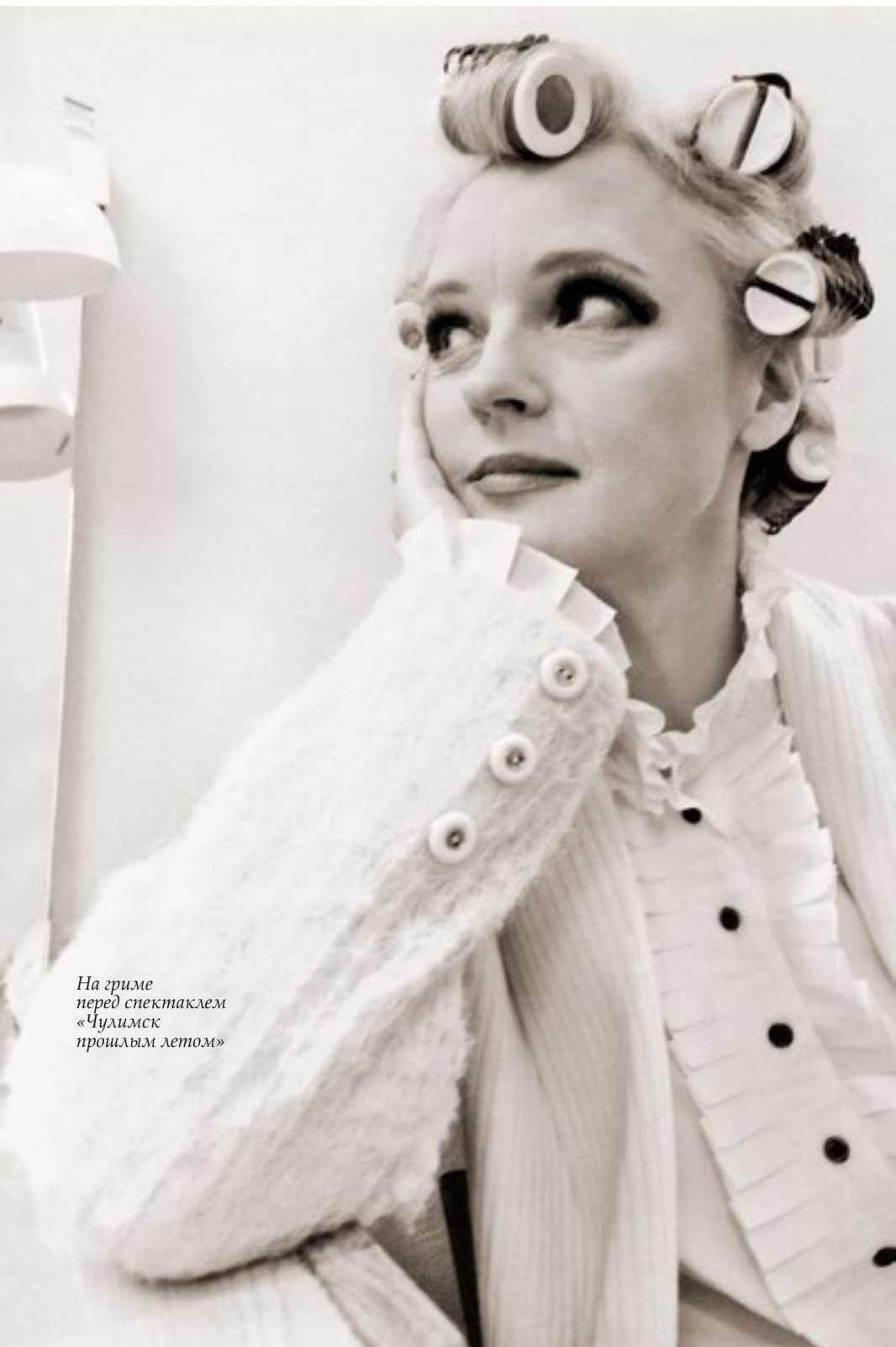
На гриме перед спектаклем «Чулимск прошлым летом»