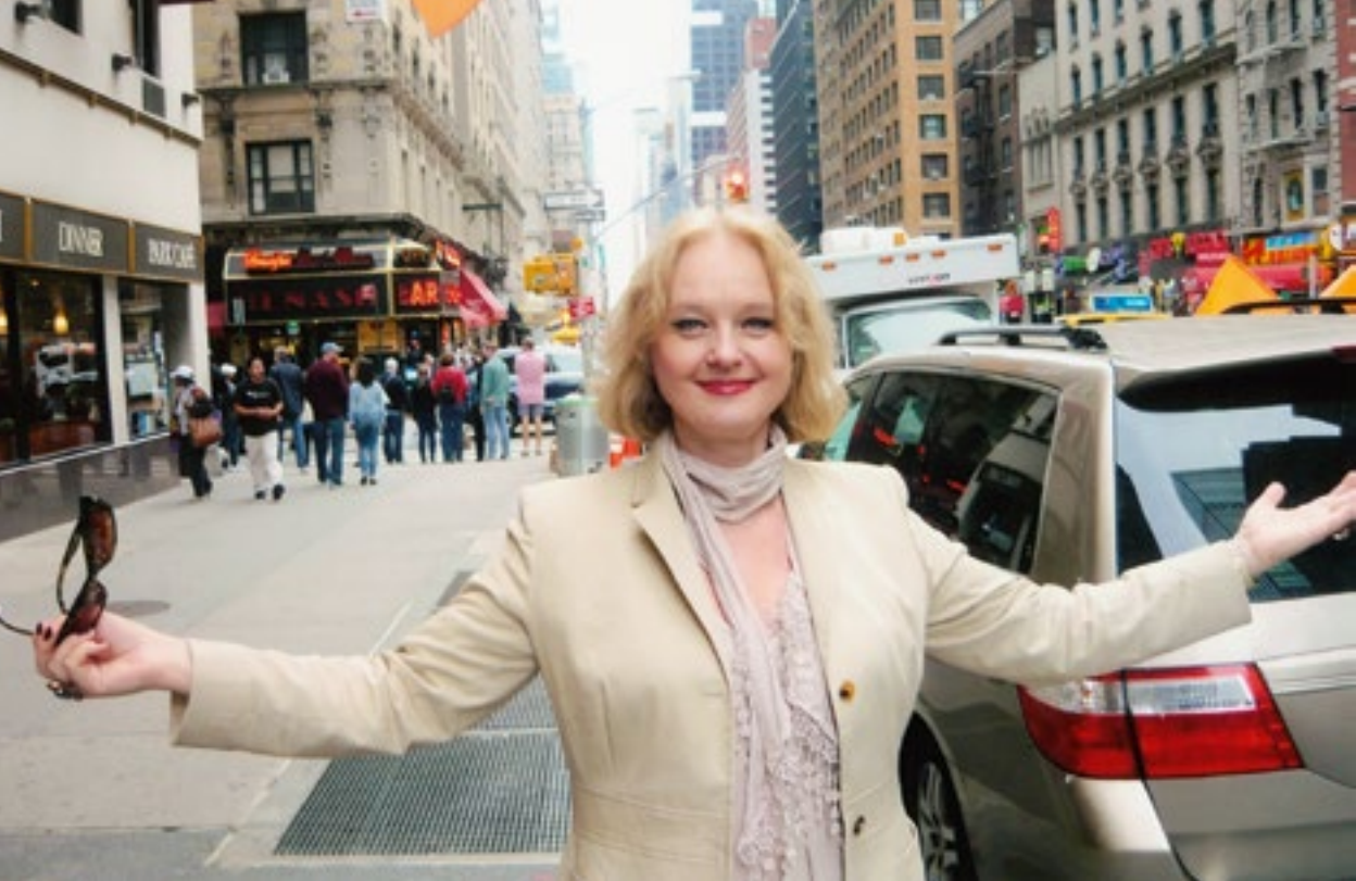
В Нью-Йорке на гастролях. 2014 г.