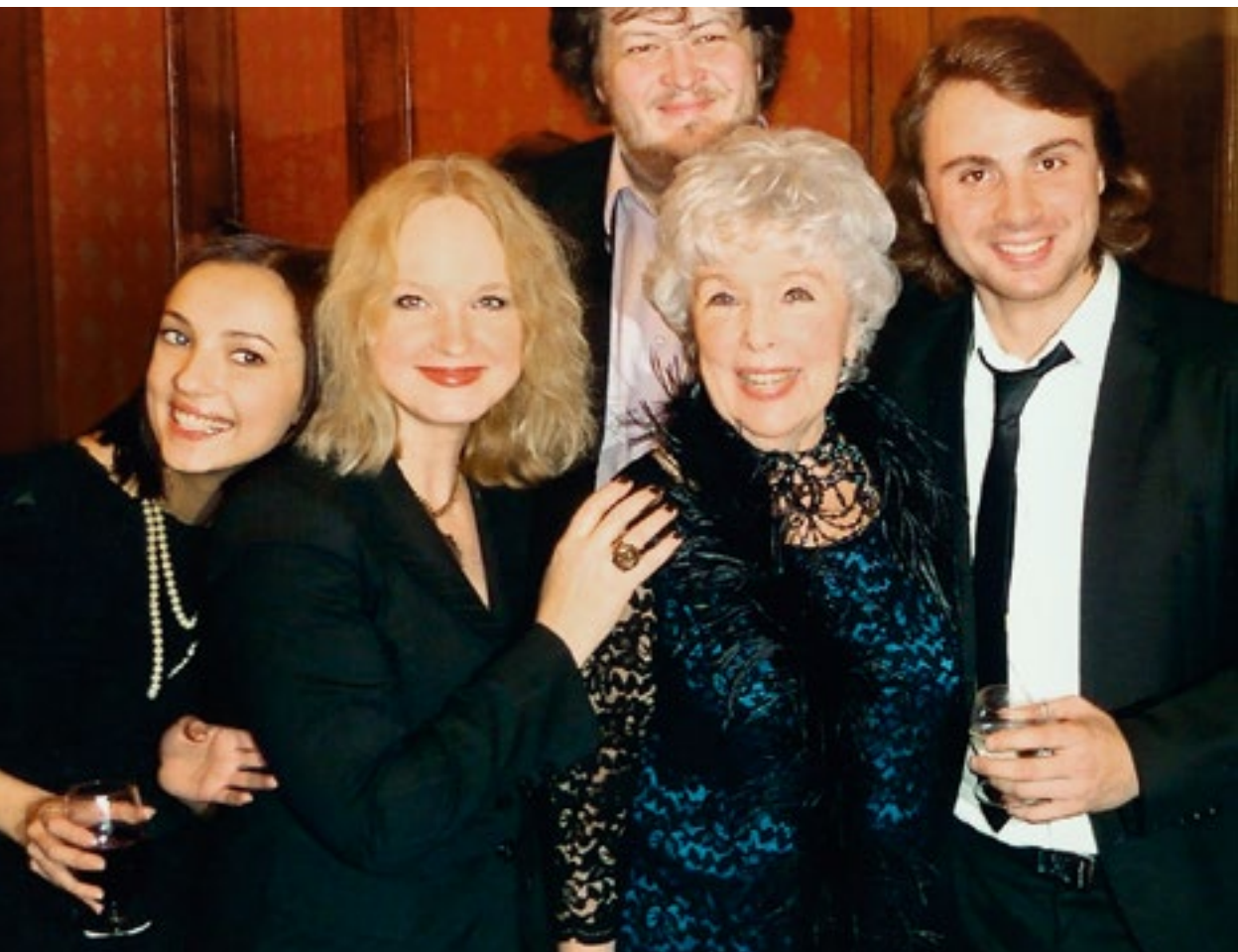
С Верой Васильевой и молодыми актерами