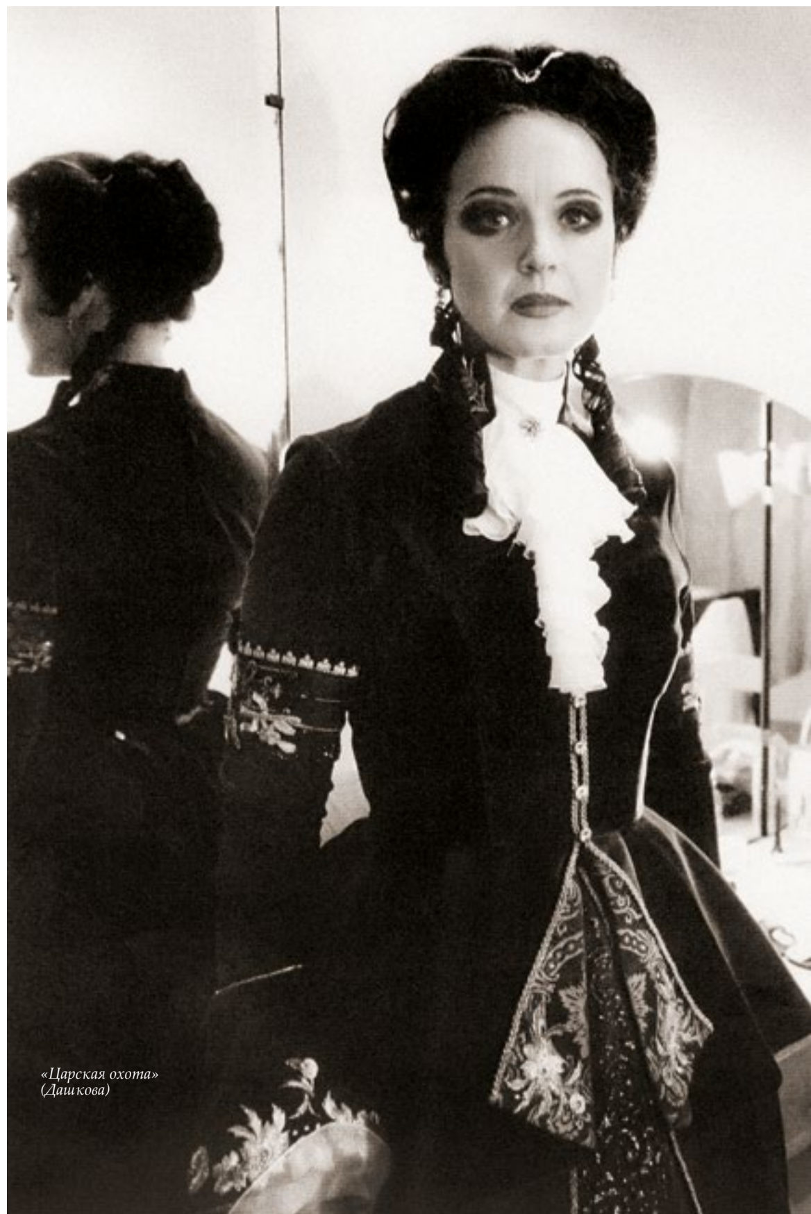
«Царская охота» (Дашкова)