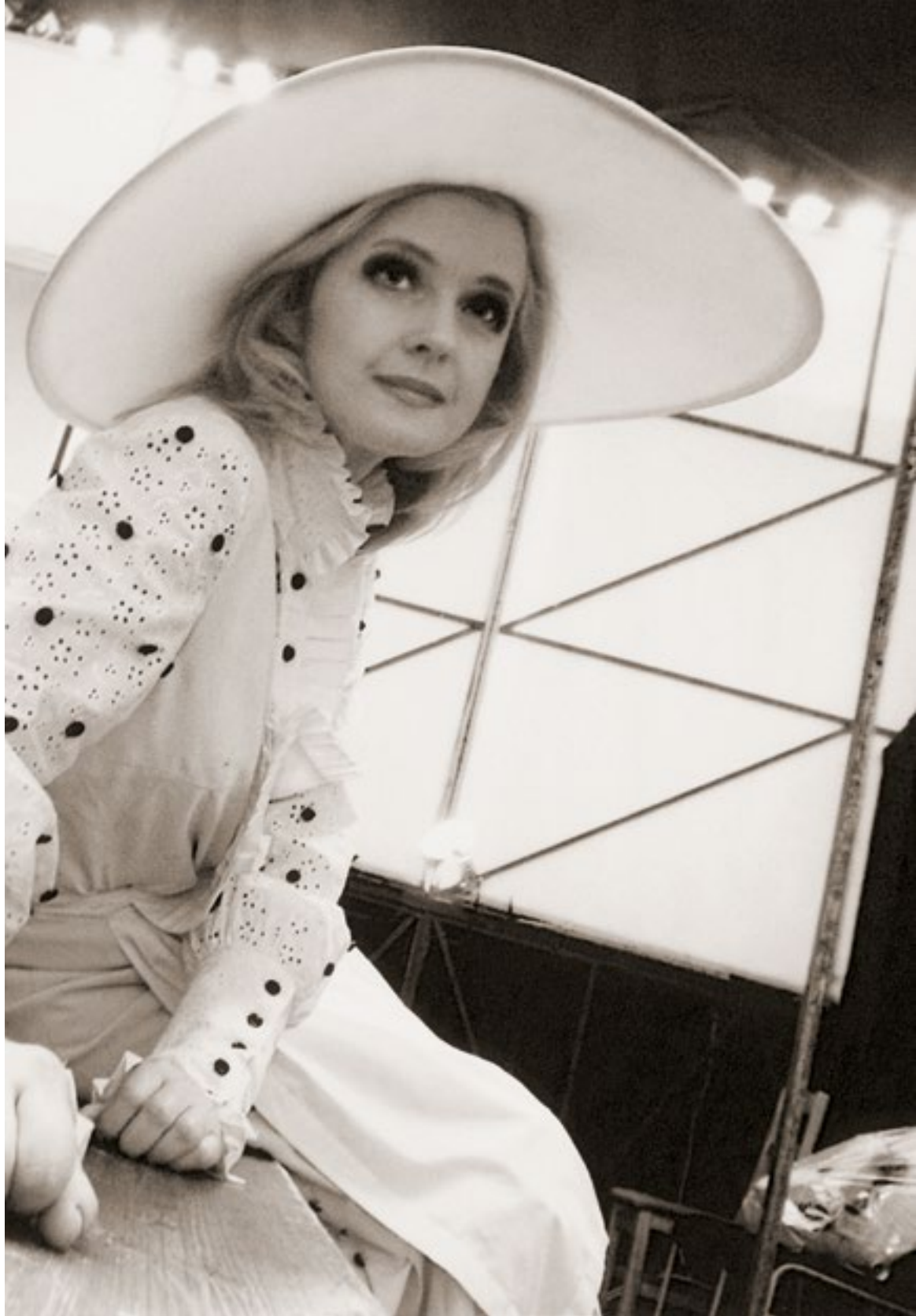
«Чулумск прошлым летом» (Хороших). 2005 г.