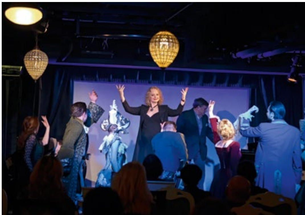
Спектакль «Если б я не была актрисой...»