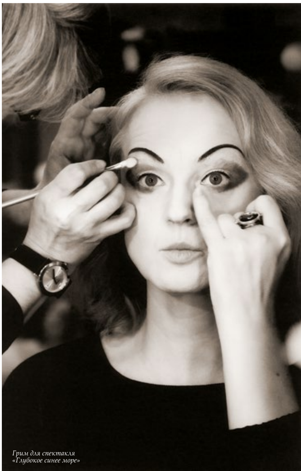
Грим для спектакля «Глубокое синее море»