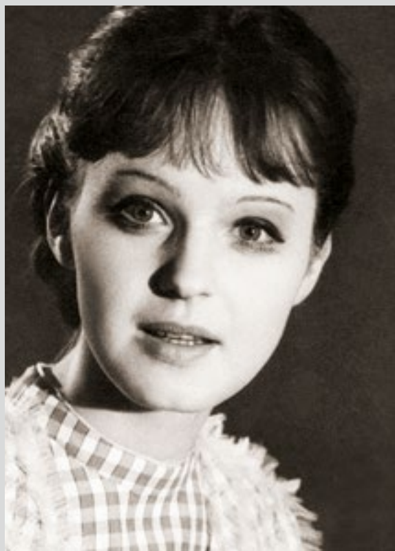
«Леший» (Соня). 1982 г.