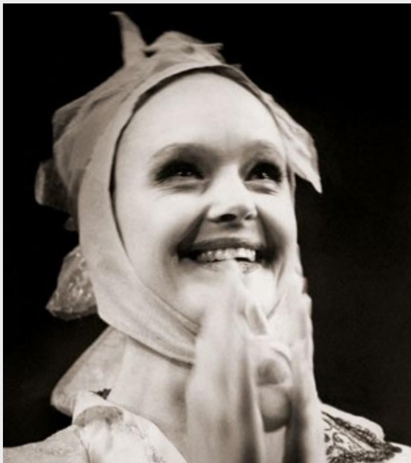
«Сирано де Бержерак» (Лиза). 2001 г.