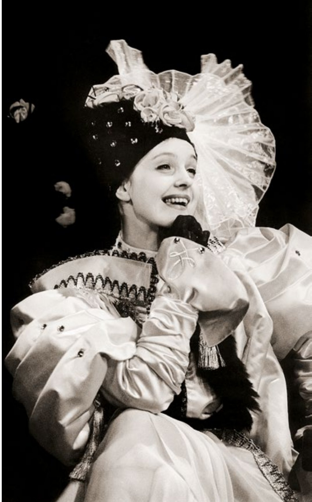
«Лев зимой» (Элинора). 1997 г.