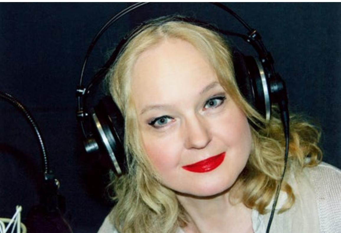
На записи аудиокниги