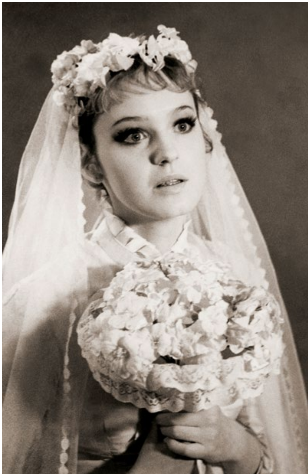
«Анна Каренина» (Кити). 1984 г.