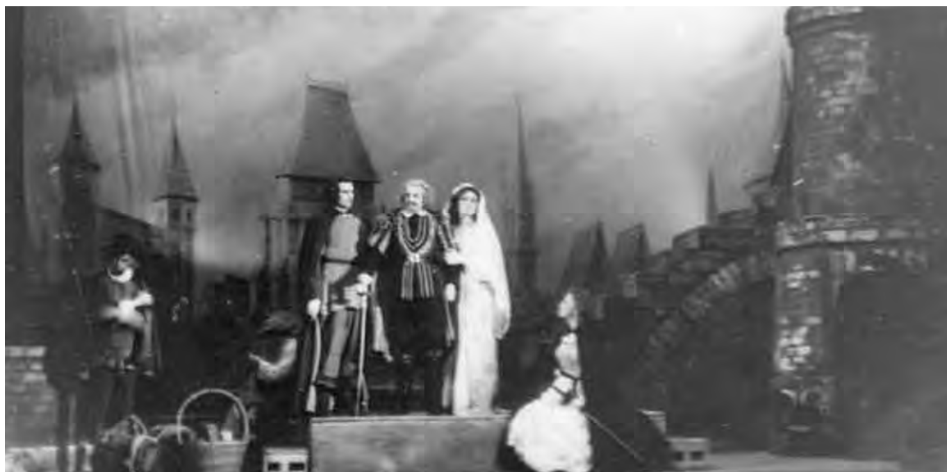
Сцена из спектакля «Осада Лейдена»

Свой первый театральный сезон Государственный театр для детей и юношества Казахстана открыл 7 ноября 1945 года премьерами спектаклей: «Красная Шапочка» Евгения Шварца, поставленный Наталией Сац и «Осада Лейдена» Исидора Штока в постановке Виктора Розова.